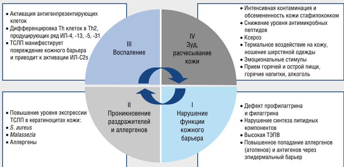
Рис. 1. Порочный круг этиопатогенетической концепции развития атопического дерматита: Th — Т-хелперы; ИЛ — интерлейкины; ТСЛП — тимический стромальный лимфопоэтин; ТЭПВ — трансэпидермальная потеря воды; S. aureus — золотистый стафилококк

За счет воздействия на процессы хемотаксиса и ангиогенеза наряду с этиологическими факторами АМП могут играть и патогенетическую роль в развитии ряда заболеваний, в частности атопического дерматита (рис. 1). Именно в коже у больных атопическим дерматитом при расчесывании не обнаруживается адекватного увеличения синтеза АМП, следствием чего является высокая чувствительность атопичной